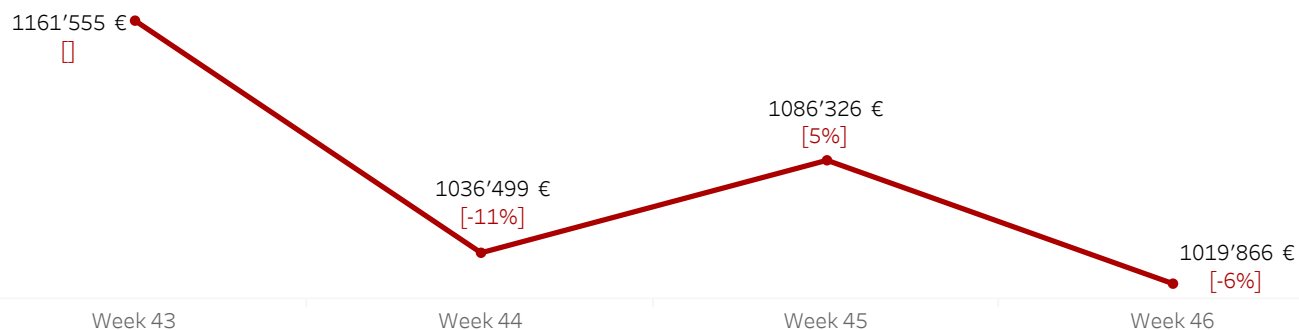
Trend Valore € (IVA esclusa) ultime 4 settimane - Δ% rispetto alla settimana precedente

Nel grafico è riportato il trend delle ultime 4 settimane del valore delle transazioni. La differenza percentuale è calcolata rispetto al valore € della settimana precedente. Week (Numero) fa riferimento al numero della settimana da inizio anno.