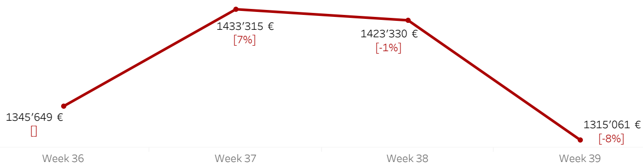
Trend Valore € (IVA esclusa) ultime 4 settimane - Δ% rispetto alla settimana precedente

Nel grafico è riportato il trend delle ultime 4 settimane del valore delle transazioni. La differenza percentuale è calcolata rispetto al valore € della settimana precedente. Week (Numero) fa riferimento al numero della settimana da inizio anno.