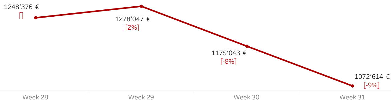
Trend Valore € (IVA esclusa) ultime 4 settimane - Δ% rispetto alla settimana precedente

Nel grafico è riportato il trend delle ultime 4 settimane del valore delle transazioni. La differenza percentuale è calcolata rispetto al valore € della settimana precedente. Week (Numero) fa riferimento al numero della settimana da inizio anno.